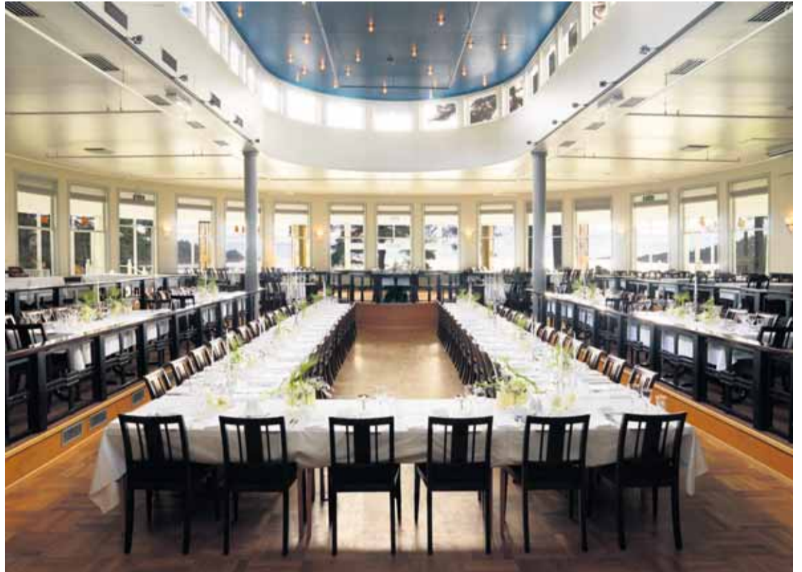
STILFULLT HOTELL: Den ferdige tilstelte hovedsalen på Hotel Fevik gir et stilfullt uttrykk for hotellets suksess de siste årene.

- På en av disse skogsturene har jeg som mål å klare å slå min mann, når vi helt impulsivt bestemmer oss for å kappløpe.